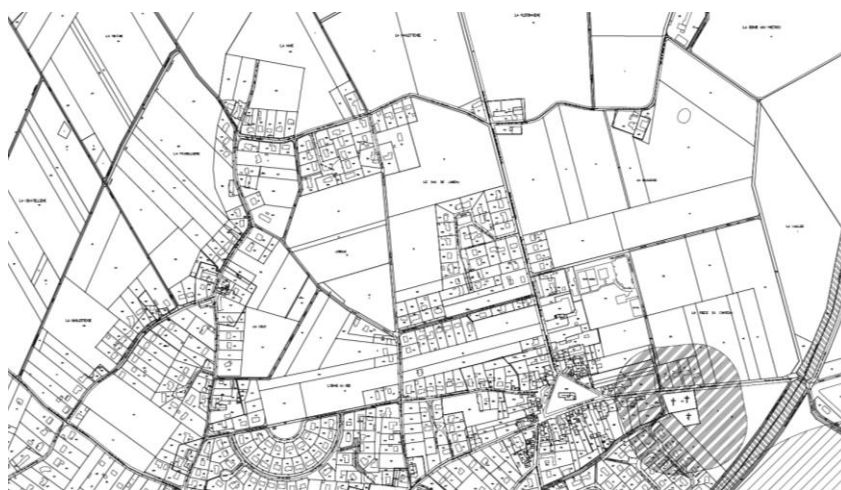
Carte 1 : Extrait du plan de servitudes d'utilité publique de la commune de Rébréchien

Le projet n'est impacté par aucune servitude d'utilité publique.